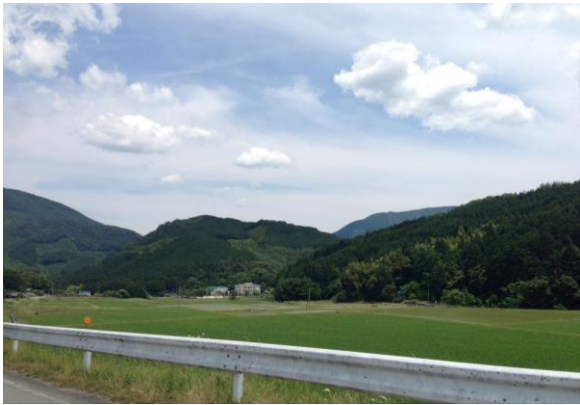
のどかな御楨地区を散策