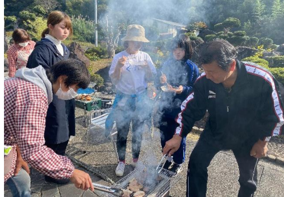
収穫した野菜と釣った魚、そしてジビエで自給自足 BBQ