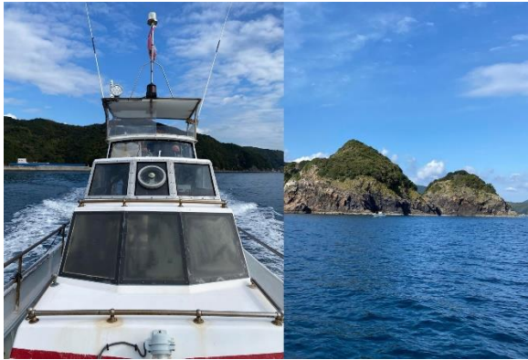
漁船に乗って漁師さんとクルージング&海釣り体験