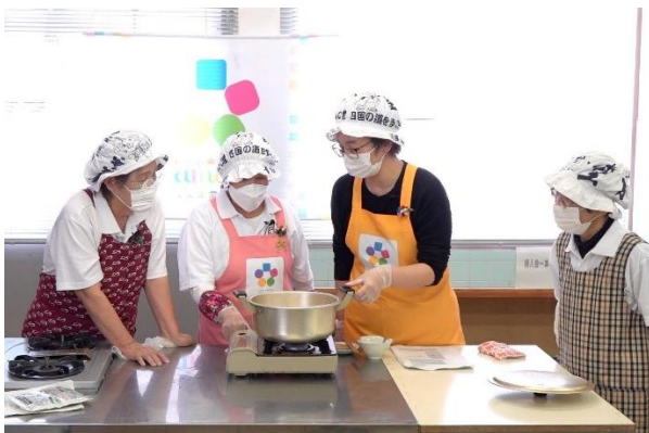
地元のおばちゃんと郷土料理づくり