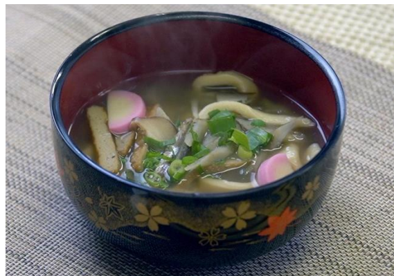
できた郷土料理でランチ