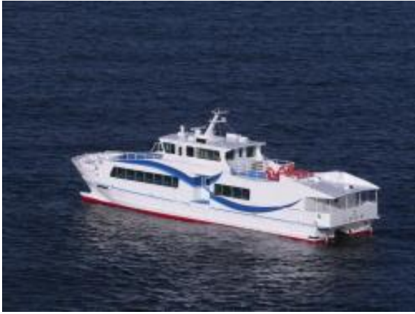
クルーズ船から宇和島の入り組んだ地形を体感